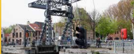
Verborgene parels in onze gemeente (p.2)