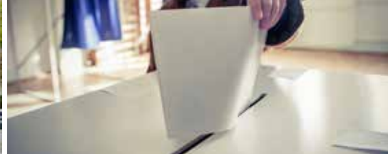
De twaalf werken van Willebroek (p.3)